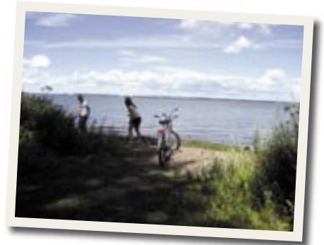
Ein Fahrrad und einen Strand - was braucht man mehr?