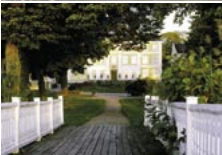
Kater Findus und Petterson, zwei beliebte Kinderbuchfiguren, wohnen im Sommer auf dem Julita Hof.