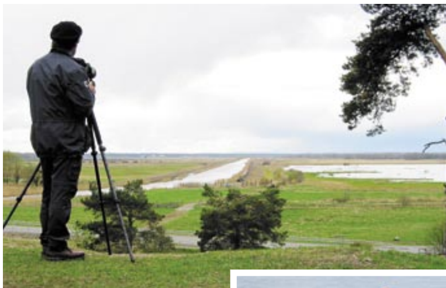
Im Naturreservat Kvismaren leben viele verschiedene Vogelarten.

Örby Kulle ist der Zentralpunkt im Naturreservat. Hier erhalten Sie vom Aussichtsturm aus und mithilfe von Karten einen guten Überblick über das Gebiet. Von Mitte Juni bis Ende September kann man in Ängfallat, der Basis der Vogelstation von