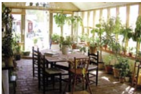
Äppelgården ist ein beliebtes Ausflugsziel für Gartenliebhaber.