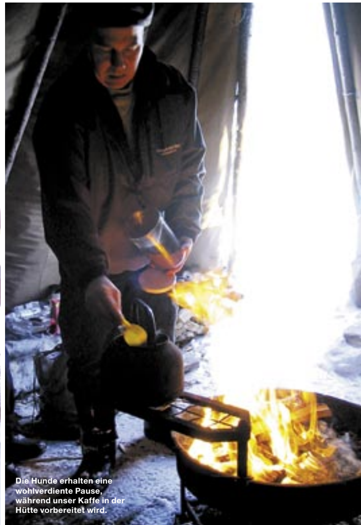
Die Hunde erhalten eine wohlverdiente Pause, während unser Kaffee in der Hütte vorbereitet wird.