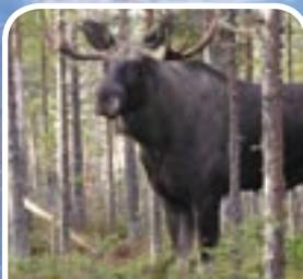
Elchpark Vittangi www.moosefarm.se