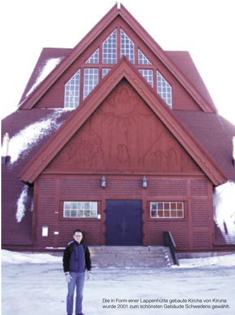
Die in Form einer Lappenhütte gebaute Kirche von Kiruna wurde 2001 zum schönsten Gebäude Schwedens gewählt.