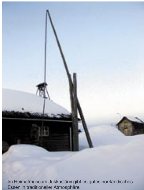
Im Heimatmuseum Jukkasjärvi gibt es gutes norrländisches Essen in traditioneller Atmosphäre.