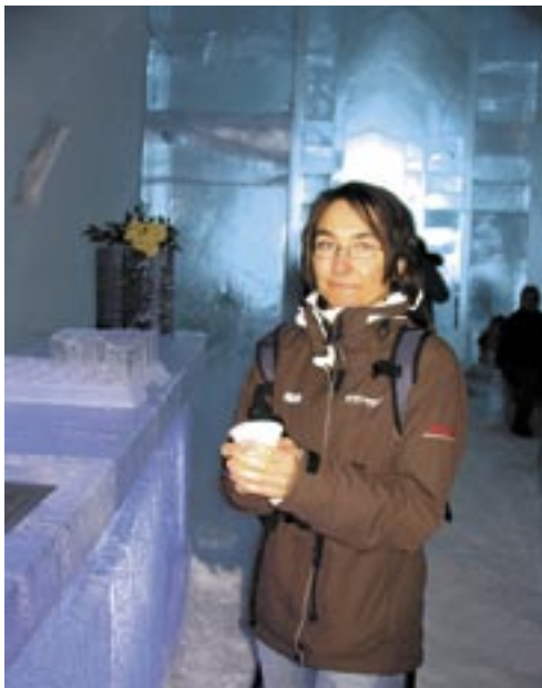
In der Absolute Icebar sind sogar die Gläser aus Eis.