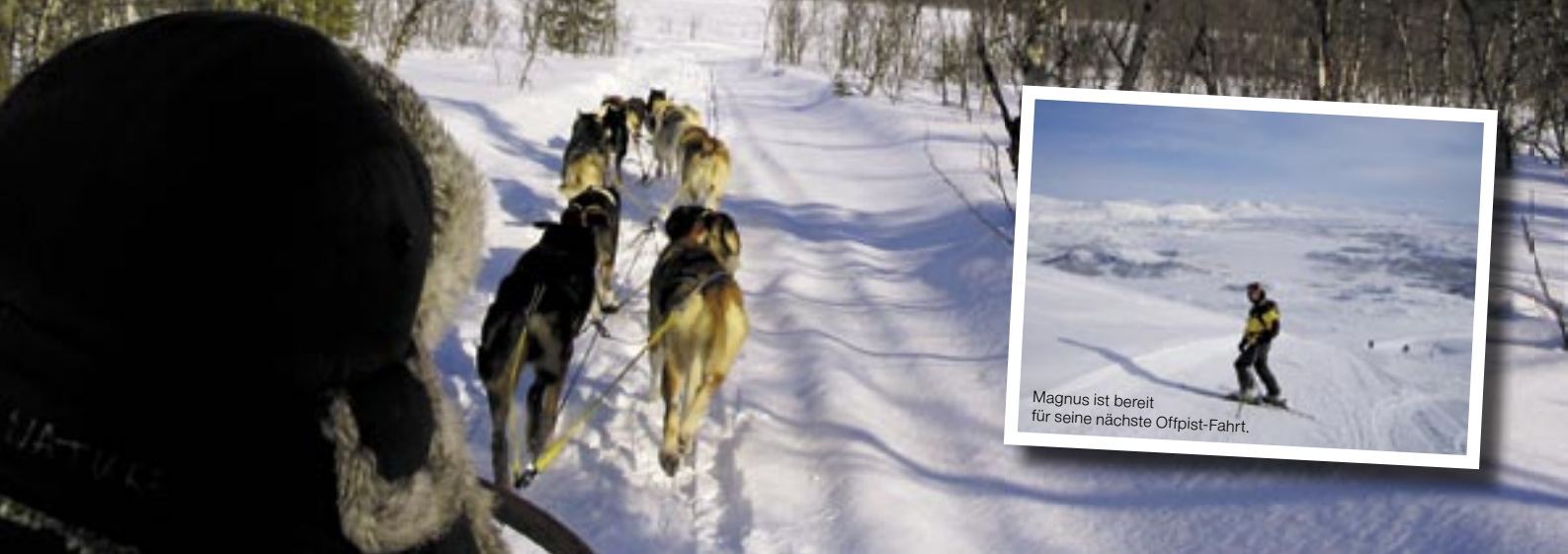
Magnus ist bereit für seine nächste Offpist-Fahrt.

In voller Fahrt durch die Wildnis. Eine Hundeschlittenfahrt ist spannend und friedlich zugleich.