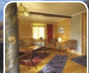
Lainio - im Reich der Flüsse www.lainio.com