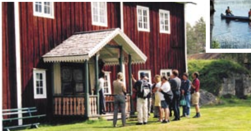
Der Gammelgården in Fågelsjö.

Im Hamra Nationalpark gibt es ein altes Urwaldgebiet mit Kiefern aus dem 17.