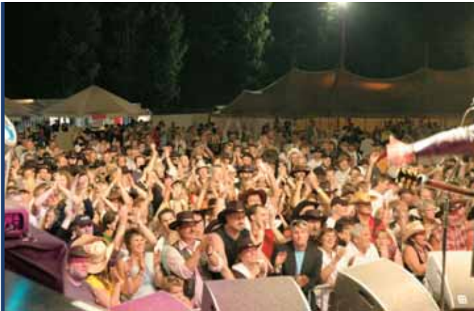
Ydre Country Festival