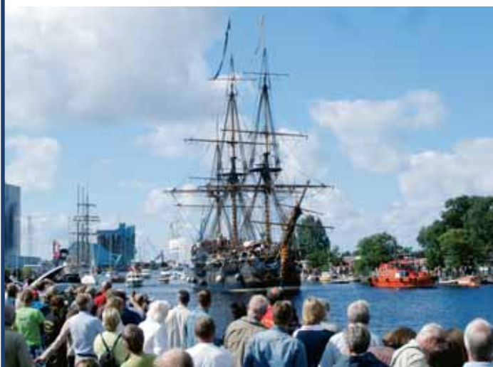
Halmstad Marinefestival und Baltic Sail

Ort: Linneryd, 40 km südlich von Växjö. Korrö ist ein altes Handwerkerdorf aus dem 19. Jahrhundert auf einer Halbinsel im Ronnebyån. Es gilt als die größte Volksmusikveranstaltung