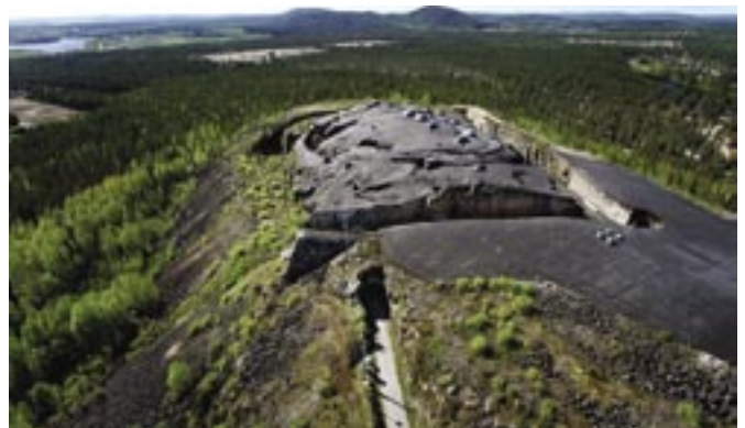
Fort Rödberg ist Boden