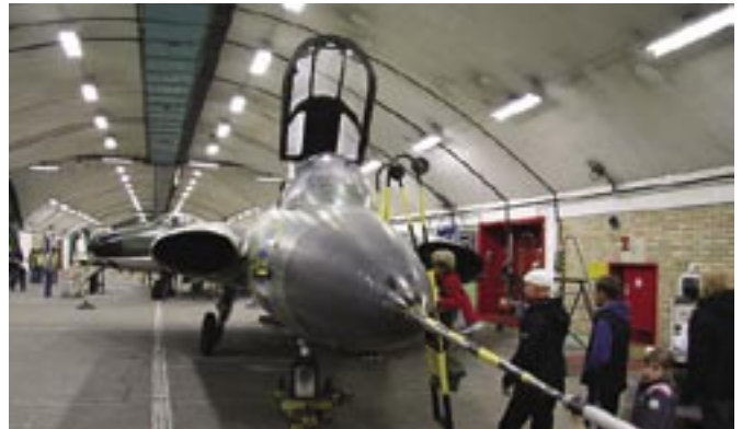
Das Aerozeum in Göteborg

Försvarmuseet: tel 0046 921 506 70, www.forsvarsmuseum.se , Rödbergsfortet: tel 0046 70 266 31 62, www.rodbergsfortet.com , Beredskapsmuseet: tel 0046 923 270 66, www.ebm.se , F 21 förbandsmuseum: tel 0046 920 387 39, www.f21.mil.se