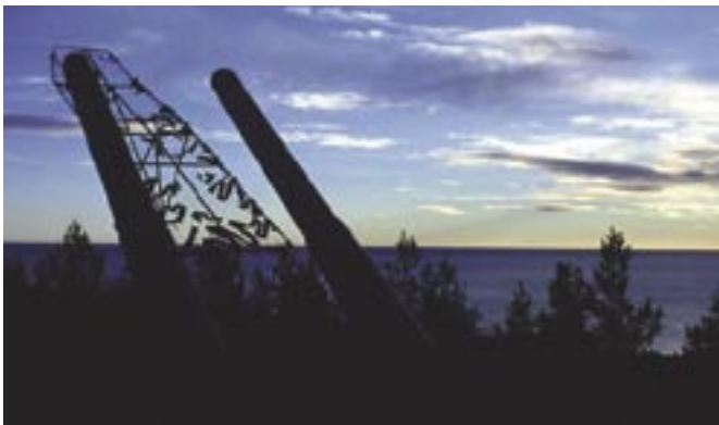
Doppelkanonen in Hemsö Festung

Tel: 0046 13 28 36 38, www.flygvapenmuseum.se