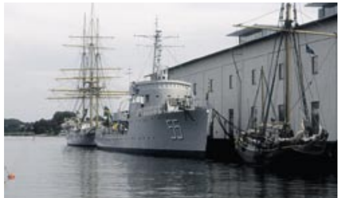
Das Marinemuseum in Karlskrona