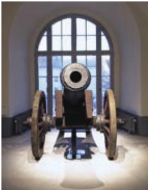
Das Armeemuseum in Stockholm