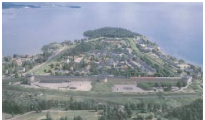
Die Festung Karlsborg