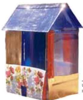
„Bräckliga boningar“, Ulla Forsell.