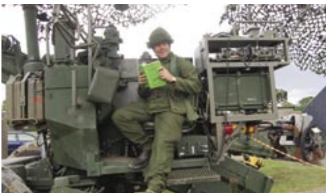
Das Bereitschaftsmuseum in Helsingborg