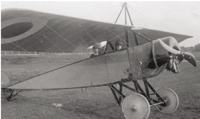
Das Luftwaffenmuseum in Linköping

Tel 0046 8 51 95 63 10, www.armemuseum.se