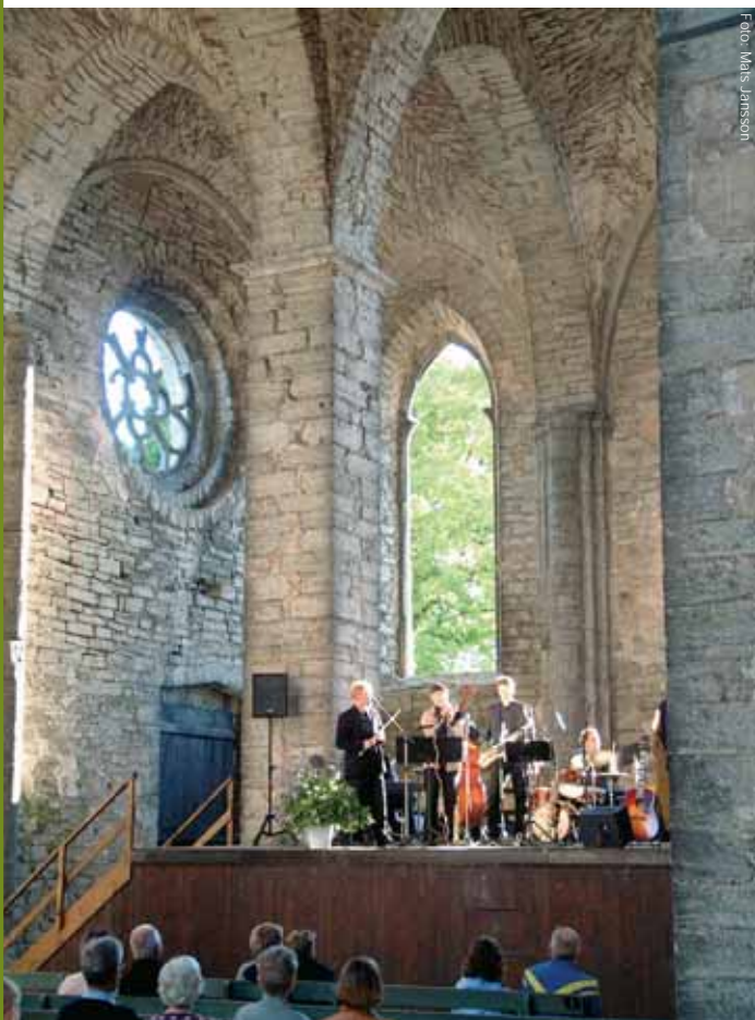
Gotland Chamber Music Festival

Karten: +46 498 20 17 00 www.gotlandchamber.se